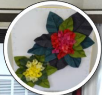
紙細工で紫陽花作り。皆さん上手に完成しました。