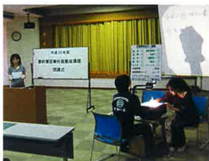
要約筆記する受講生

閉講式では、受講生の一言スピーチを他の受講生が要約筆記し、講座で学んだ成果を披露していました。