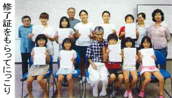
修了証をもらってにこり

発行 社会福祉法人島原市社会福祉協議会 本所 島原市霊南一丁目17番地 (島原市福祉センター) TEL 0957-63-3855 支所 島原市有明町大三東戊1352番地1 (島原市有明福祉センター1階) TEL 0957-65-9090 ホームページ http://www.shimabara-shakyo.or.jp メール info@shimabara-shakyo.or.jp