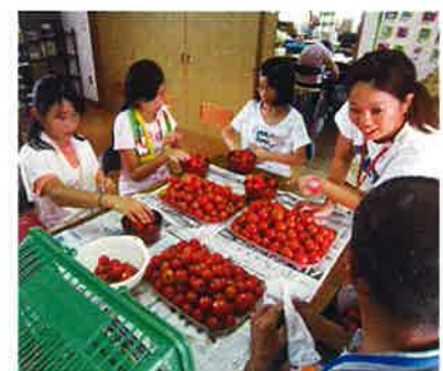
ネットワークセンターひかりでは、トマトのふくらぎめを一緒にしました。

体験を済ませた後は、参加した小学生に感想文を書いてももらいましたが、「障がいがある人に負けないように、たくさんの笑顔を作っていきたい」「いろいろなボランティアに参加してみたい」「困っている人がいたら助けようと思う」「目の不自由な人と接するときは、やさしく声をかけることに気をつけます」など、