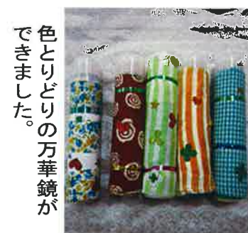
色とりどりの万華鏡ができました。

定が激しい雨が降っていたため中止となりましたが、障がい者の日常生活のお話を聞いたり、アイマスク体験や点字体験、手話体験をしました。