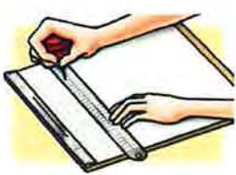
点字版を使って文字を打ちます

島原市社会福祉協議会では、夏休み子ども点字教室の受講生を募集します。 【期間】7月22日(月)～8月29日(木) 毎週月・木曜日(全10回)