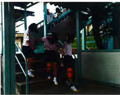
疑似体験をする三会中生

福祉について理解を深めようと6月13日、三会中学校の3年生44名が福祉体験学習を行いました。この日は、高齢者疑似体験、手話、点字の3コースに分かれ体験しました。体験後の生徒の感想では「点字や手話に興味を持って、当たり前にしていることが当たり前に出来なく大変だと思った。」7月に