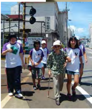
◀目の不自由な方の介助をしながら買い物に行きました。

8月19日(日)、毎年恒例の母子父子家庭ハイキングに出かけました。今年、諫早市の山茶花高原ピクニックパークへ母子家庭と父子家庭の親子47名の参加でした。