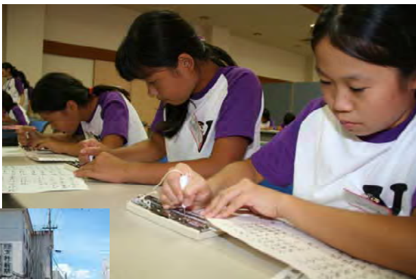
▶点字で自己紹介の文章を書いてみました。

ました。初めて経験したことともたくさんあり、「目の不自由な方と買い物と一緒にいきました。きんちょうしてなかなか声が出ませんでした。けれどなれてきて